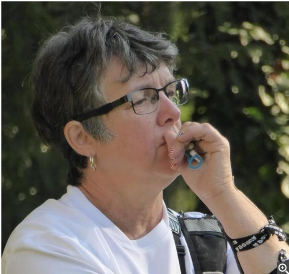
Vice-championne d'Europe et championne du monde, Chantal Porte a signé une saison 2016 exceptionnelle.